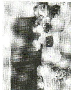
Музыкальная игра «Кот и мышка».